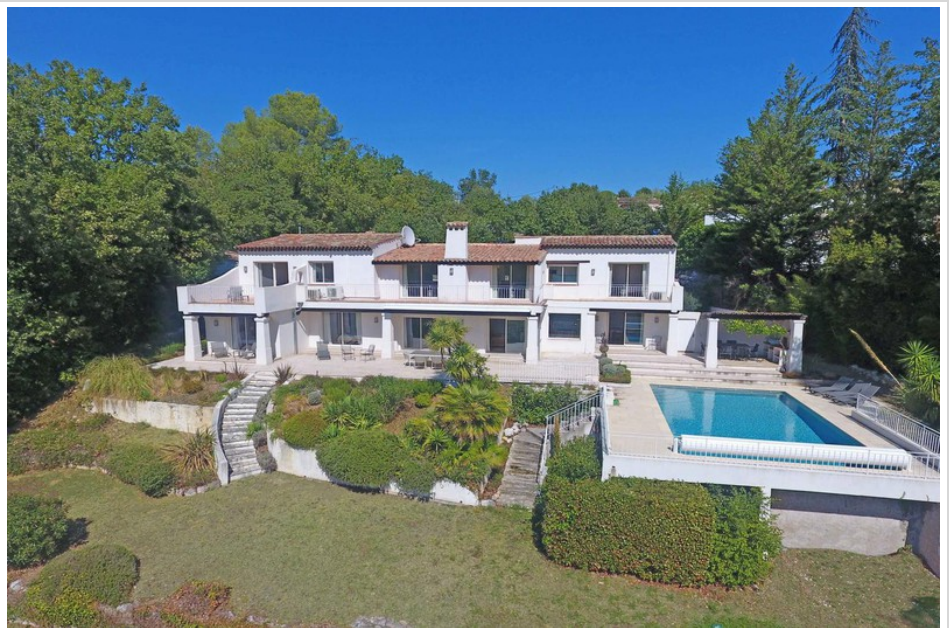
Maison 3499 Vence