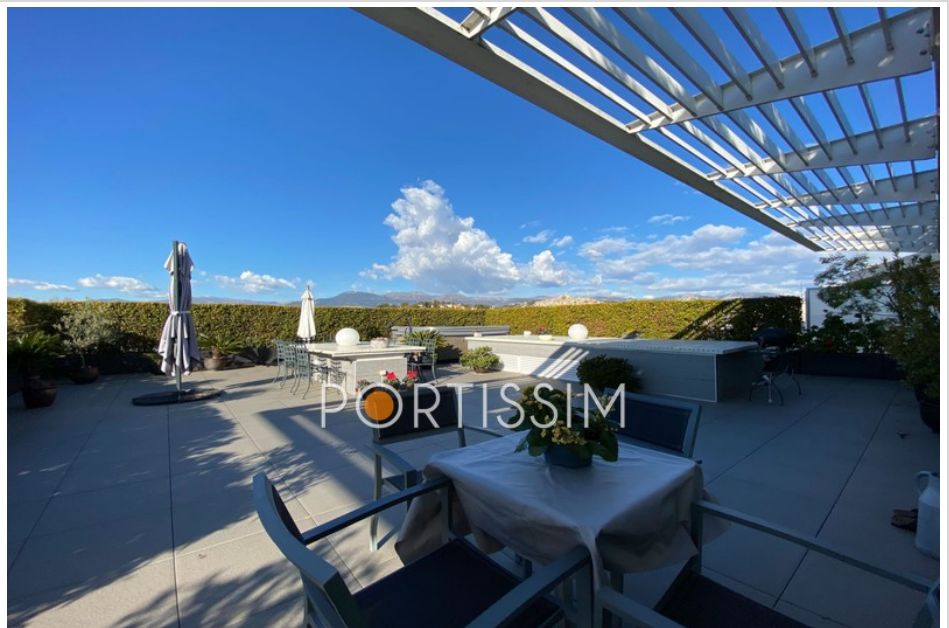
Apartment 25422 Cagnes-sur-Mer

5,02% TTC d'honoraires inclus à la charge de l'acheteur (1 095 000 € hors honoraires), well condominium(60 lots in the condominium), annual current expenses 15 240 €(1 270 € par mois), aucune procédure en cours, information on the risks to which this property is exposed is available on georisques.gouv.fr