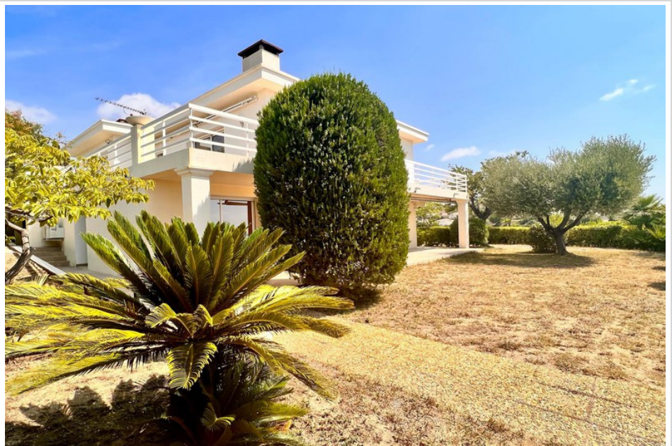
Maison 368 Cagnes-sur-Mer

honoraires inclus aucune procédure en cours, les informations sur les risques auxquels ce bien est exposé sont disponibles sur georisques.gouv.fr